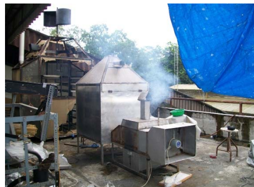
Gambar 4 Alat penukar kalor plat datar diletakkan di atas tungku pembakaran pada mesin pengering RDF

Hal ini perlu dilakukan untuk mengetahui besarnya masa jenis, konduktivitas thermal, kalor spesifik, viskositas dinamik dan bilangan prandtl dari masing-masing fluida yang sedang mengalir melalui alat penukar kalor.