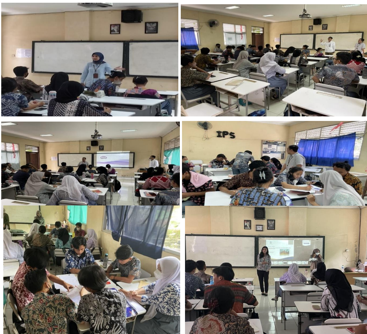
Gambar 4. Kegiatan Abdimas

Berikut merupakan dokumentasi selama kegiatan berlangsung dalam hal pendampingan siswa-siswi kelas XII jurusan IPS SMAN 4 Kota Tangerang Selatan.