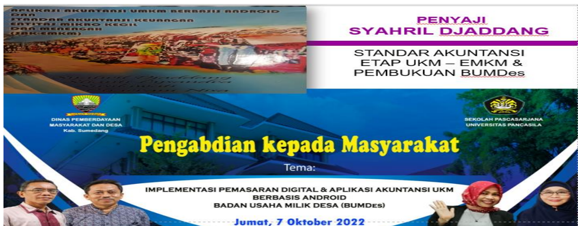
Gambar 2; Standar Akuntansi ETAP UKM – EMKM & Pembukuan BUMDes