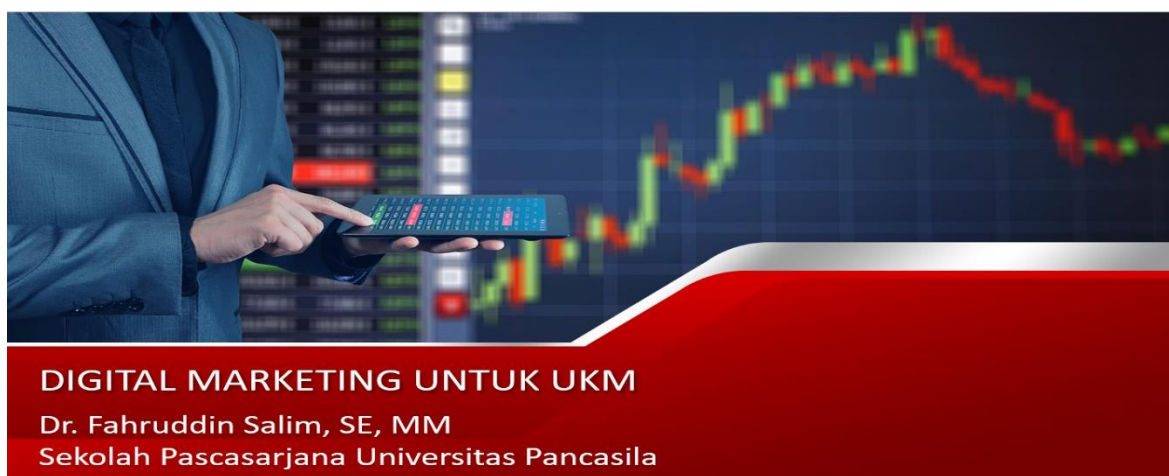
Gambar 1; Digital Marketing Untuk UKM

Kemudian masuk ke tema ke 2 tentang “Standar Akuntansi Keuangan ETAP UKM_EMKM & Pembukuan BUMDes”, materinya meliputi :