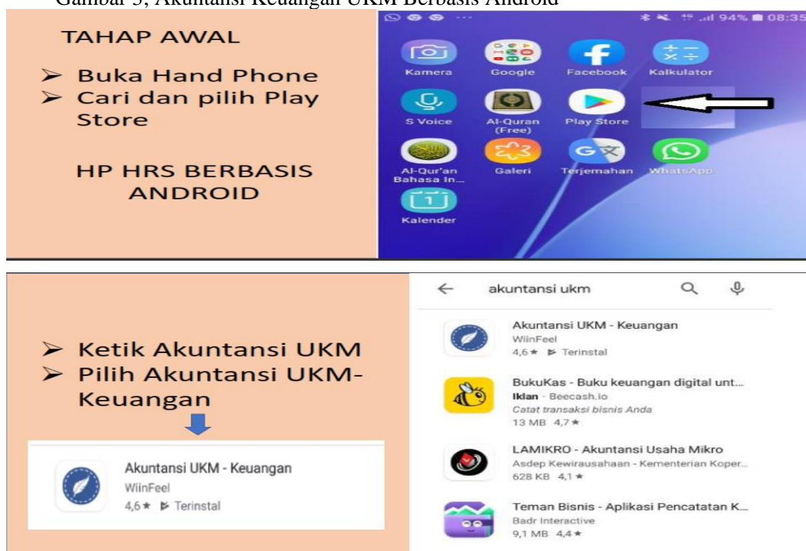
Gambar 3; Akuntansi Keuangan UKM Berbasis Android

Secara umum, pelaksanaan pengabdian ini berdampak positif, para pelaku UMKM yang rata-rata masih muda dan melek terhadap kondisi saat ini yang serba digital dan memanfaatkan teknologi, memudahkan mereka untuk memahami secara cepat bagaimana pentingnya pemasaran yang sudah harus dilakukan secara e-commerce/ digital marketing, serta bagaimana pentingnya pembukuan yang harus rutin dilakukan untuk mengetahui kinerja keuangan pelaku UMKM setiap tahunnya pada gambar 3, berikut ini;