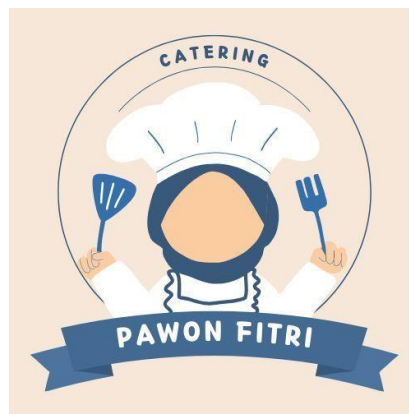
Gambar 4 2 Logo Akun Media digital UMKM pawon fitri

Akun Instagram tersebut dibuat untuk membantu UMKM agar dapat mempermudah banyak orang yang mengenalnya, Karena itu kami mahasiswa membantu UMKM catering pawon fitri dapat dijual melalui platform penjualan online melalui media sosial. Selain membuat akun digital, kami juga melakukan pemotretan produk serta pembuatan logo UMKM sebagai bentuk dukungan dalam proses pembuatan desain UMKM pawon fitri. Berikut terdapat logo UMKM pawon fitri: