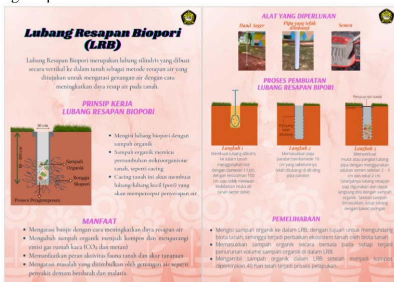
Gambar 3. Flier Infografis terkait Lubang Resapan Biopori

Rencananya karena lokasi yang tidak memungkinkan, maka penyampaian materi penyuluhan tidak dilakukan dengan menggunakan presentasi materi pada masyarakat. Sebaliknya akan digunakan flier yang disebar pada masyarakat yang hadir sambil mendengarkan penjelasan dari narasumber terkait definisi, manfaat, dan fungsi dari aplikasi pembuatan lubang Biopori.