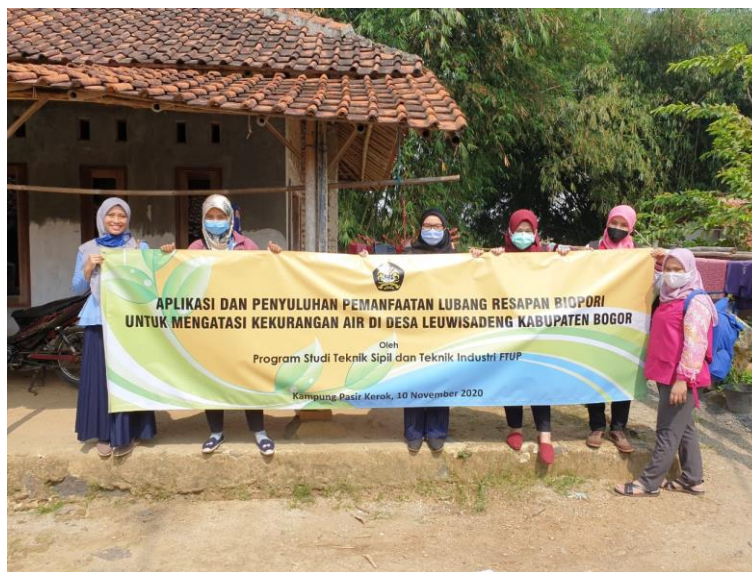
Gambar Error! No text of specified style in document. -1 Kegiatan Penyuluhan Lubang Biopori

Proses pelaksanaan kegiatan berlangsung cukup meriah juga disambut baik oleh perwakilan ketua RT dan beberapa tokoh masyarakat. Kegiatan penyuluhan selesai dilaksanakan tepat pukul 11.00 yang kemudian diakhiri dengan penutupan Tim PKM Bersama para warga kampung di lokasi kegiatan.