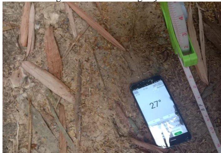
Gambar 1. Rancangan Pembangunan Infrastruktur Jalan

Pembuatan infastruktur jalan disepanjang jalan lingkungan sangat membantu Warga Desa Leuwisadeng khususnya pada Kampung Baragajed dan Kampung Pasir Salam untuk aktivitas sehari-hari. Dalam pra pelaksana ini Mahasiswa tidak bisa melaksanakan kegiatan pengabdian pada masyarat dikarenakan seluruh dunia sedang menghadapi wabah Covid-19. Maka dari itu, pelaksanaan kegiatan pengabdian masyarakat ini terhambat. Mahasiswa melakukan survei ke Kampung Baragajed dan Kampung Pasir Salam untuk mengukur sudut kemiringan jalan tersebut.