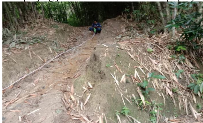
Gambar 2. Mengukur Panjang Jalan

Pada Gambar 1. Selesai mengukur sudut kemiringan jalan di Kampung Baragajed dan Kampung Pasir Salam beberapa Mahasiswa yang mengikuti survei ke Desa Leuwisadeng melakukan pengukuran panjang jalan untuk memastikan berapa panjang jalan sebenarnya.