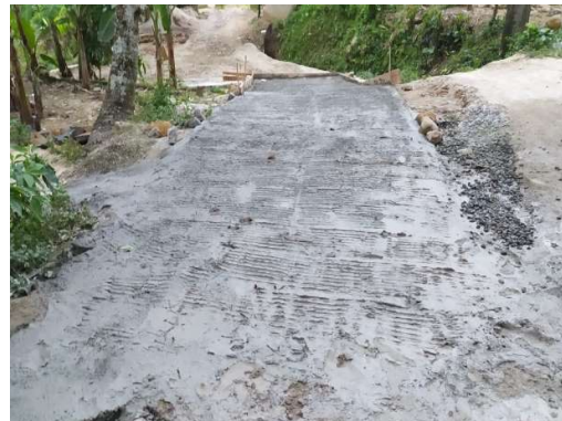
Gambar 7. Pemberian anti slip jalan