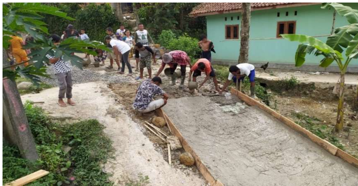
Gambar 5. Proses Pengecoran Jalan

Barulah setelah wiremesh dipasang dilakukan penghamparan campuran beton, tetapi sebelumnya tidak lupa pemasangan bekisting pada pinggir-pinggir jalan agar campuran beton tidak tumpah.