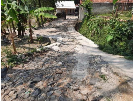
Gambar 1. Kondisi Jalan Eksisting