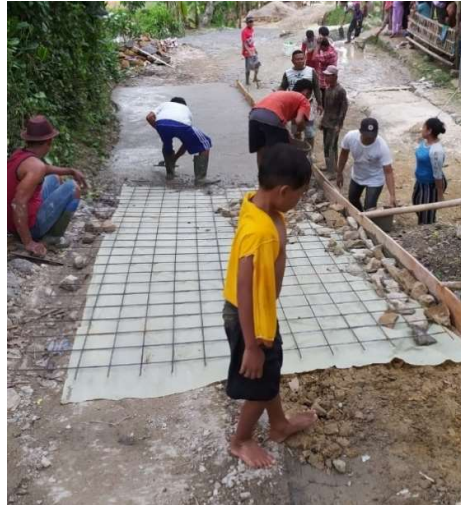
Gambar 4. Pemasangan plastik cor dan besi wiremesh

Barulah setelah wiremesh dipasang dilakukan penghamparan campuran beton, tetapi sebelumnya tidak lupa pemasangan bekisting pada pinggir-pinggir jalan agar campuran beton tidak tumpah.