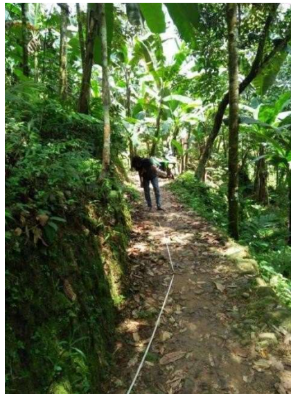
Gambar 3. Pengukuran Jalan

Survei yang dilakukan bertujuan agar menentukan lokasi pekerjaan pembangunan jalan dan menentukan Panjang dan lebar jalan yang akan dibangun, sehingga penggunaan material bisa disesuaikan dengan anggaran yang ada.