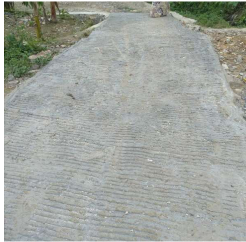
Gambar 8. Pemberian anti slip jalan