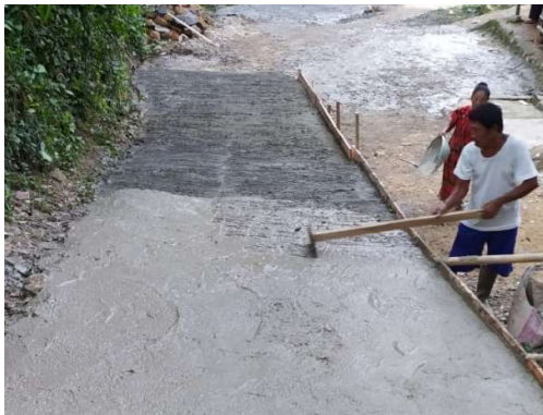
Gambar 6. Perataan jalan

Setelah dicor jalan harus diratakan dan diberi anti slip dengan cara mengores-gores beton yang masih basah, sehingga ketika hujan jalan tidak licin.