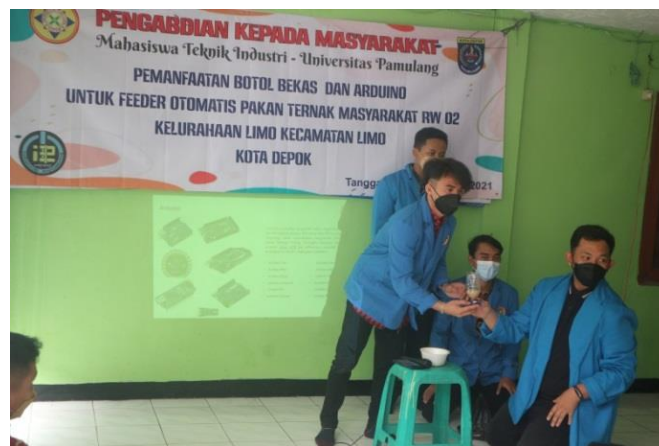
Gambar 2. Pelaksanaan Penyuluhan

Proses penyuluhan berlangsung dengan lancar dan peserta sangat antusias dalam mengikutinya. Materi penyuluhan dapat disampaikan secara keseluruhan meskipun tidak secara detil karena keterbatasan waktu. Berikut ini merupakan gambaran saat penyuluhan berlangsung.