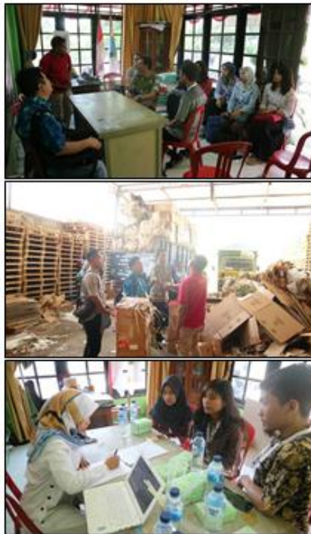
Gambar 2. Kegiatan-kegiatan yang dilaksanakan ketika Pengabdian

Selanjutnya, dalam kegiatan penyusunan matriks risiko, tim pengabdian mencoba memberikan gambaran mengenai pentingnya manajemen risiko bagi sebuah organisasi. Manajemen risiko adalah pendekatan/metodologi terstruktur untuk mengelola ketidakpastian terkait ancaman. Kegiatan dalam manajemen risiko diantaranya adalah penilaian risiko, mengembangkan strategi untuk mengelolanya dan mitigasi risiko menggunakan pemberdayaan/manajemen sumber daya (Susanto & Meiryani, 2018). Dalam prakteknya, perlu penulis batasi bahwa penyusunan matriks sederhana ini dilakukan lebih ke dalam rangka peningkatan kesadaran BUMDes Kemudo Makmur akan pentingnya pemahaman risiko yang ada dan bagaimana cara menghadapinya. Sehingga belum dapat dikatakan matriks risiko yang sempurna.