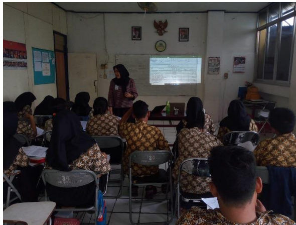
Gambar 3. Kegiatan Pelatihan Perhitungan Laporan Rekonsiliasi Fiskal dan Penyusunan SPT Tahunan.