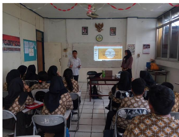
Gambar 2. Pembukaan Kegiatan Pelatihan Bersama dengan Guru SMK LP3 ISTANA

Hal ini sesuai dengan tujuan awal kegiatan, yaitu untuk menambah pengetahuan siswa mengenai cara merekonsiliasi laporan fiskal dan cara pengisian SPT dengan benar ketika bekerja langsung di dunia industri.