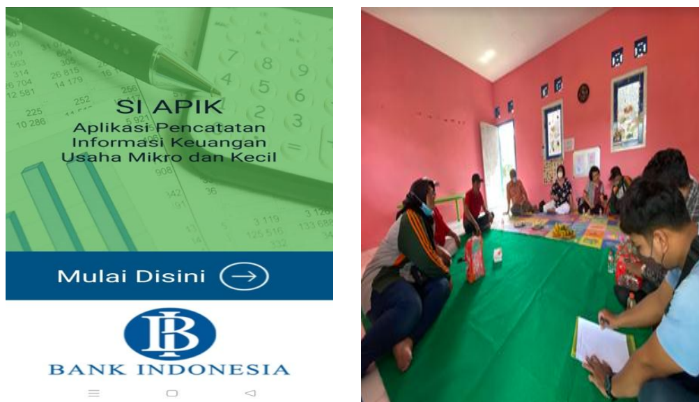
Gambar 6. Pelatihan Aplikasi SIAPIK

Pelatihan penggunaan aplikasi akuntansi SIAPIK dilakukan oleh anggota Tim Pelaksana Abdimas dari prodi Akuntansi. Peserta pelatihan adalah ibu-ibu pengurus KWT. Pengurus KWT mempunyai kewajiban untuk mempertanggungjawabkan keuangan kepada para anggotanya. Gambar 6 di bawah ini menunjukkan pelatihan akuntansi SIAPIK.