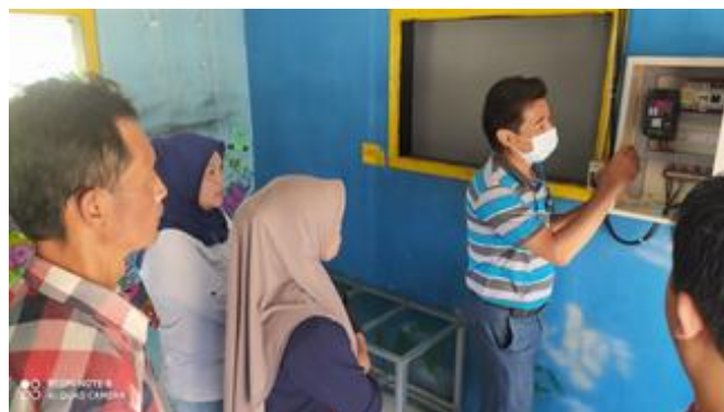
Gambar 5. Pelatihan Penggunaan Pompa Air dan Alat Penyiraman

Tim Pelaksana Abdimas memberikan pelatihan cara menggunakan pompa air dan alat penyiraman. Pelatihan diberikan kepada pengurus KWT dan anak-anak muda kelompok Brassican, bahkan beberapa warga yang tertarik dengan hasil kerja Tim juga mengikuti pelatihan tersebut. Gambar 5 di bawah ini menunjukkan pelatihan yang diberikan oleh Tim Pelaksana Abdimas.