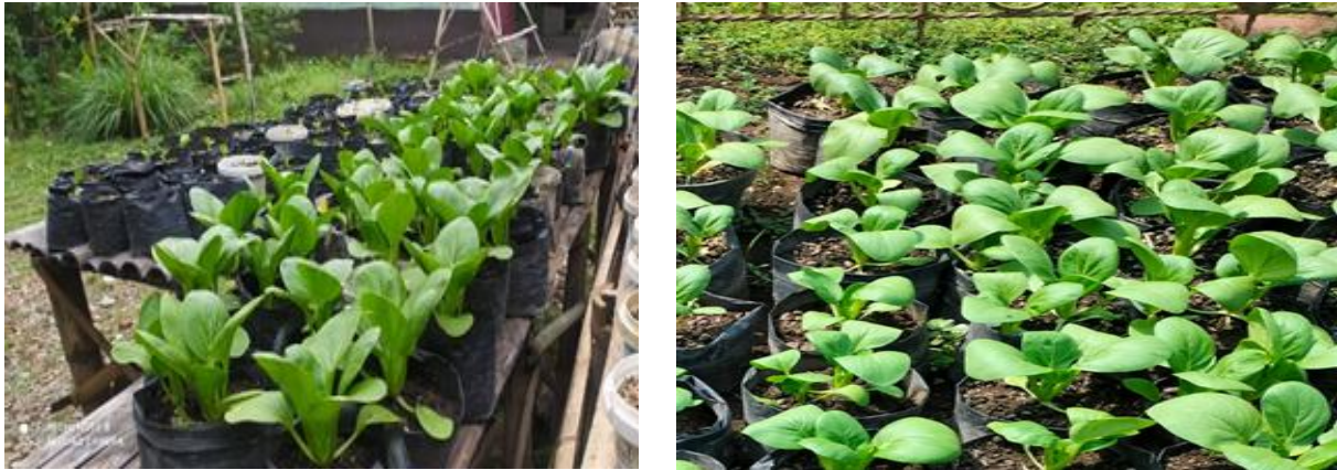
Gambar 1. Sawi Umur 28 Hari

Panen harus dilakukan secara disiplin, karena keterlambatan panen mengakibatkan sawi menjadi tua sehingga tidak disukai oleh konsumen. Sebaliknya apabila panen dilakukan lebih cepat, pasar atau konsumen masih mau membeli sawi muda. Oleh karena itu, panen pada masanya merupakan batas waktu paling lama yang ditetapkan pengurus KWT.