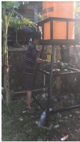
Gambar 4a. Pompa Air

Fakultas Teknik UKWMS. Hasil pemasangan pompa air bertenaga surya dan alat penyiraman air ditunjukkan pada Gambar 4 di bawah ini.