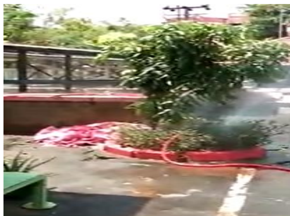
Gambar 3b. Hasil Uji Coba