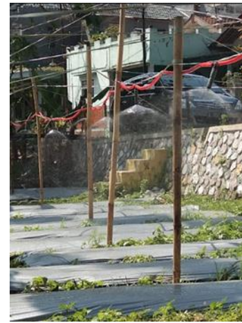
Gambar 4c. Hasil Kerja Alat