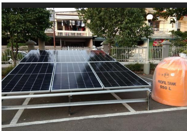
Gambar 3a. Panel Surya