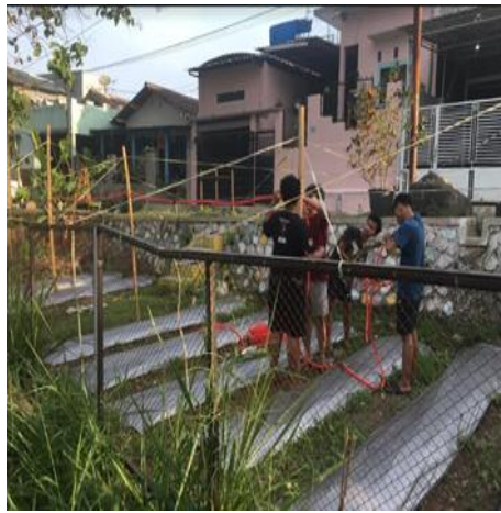
Gambar 4b. Penyiraman Air