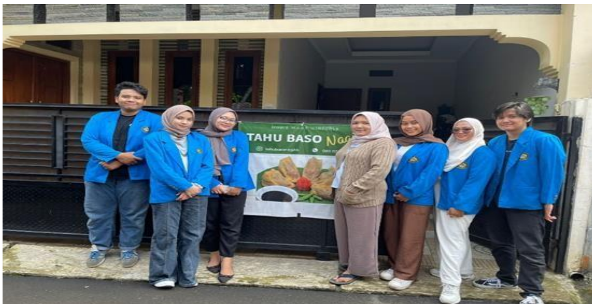
Gambar 2. Foto Dengan Pengusaha UMKM Tahu Nagih

Kuliah Kerja Nyata dilaksanakan pada tanggal 8 Desember 2022 sampai 15 Desember 2022 dengan lokasi berada di Bogor, Pelaksanaan diawali dengan melakukan observasi pembukuan yang dibuat oleh kedua UMKM tersebut. Setelah mengetahui sistematika dan prosedur pembukuan laporan keuangan UMKM tersebut secara tradisional, kami melakukan pengenalan aplikasi Temanbisnis kepada UMKM tersebut. Sehingga UMKM tersebut diharapkan dapat memahami penggunaan aplikasi Temanbisnis dan memiliki informasi keuangan yang lebih baik lagi sehingga tidak ada kesalahan dalam pencatatan keuangan. Melakukan pengenalan strategi marketing secara digital melalui media sosial dengan cara memberikan penjelasan berupa arahan sehingga kedepannya diharapkan dapat mencapai lebih banyak pelanggan.