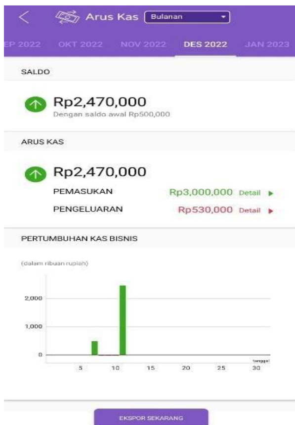
Gambar 6. Pencatatan Pengeluaran Dan Pemasukan