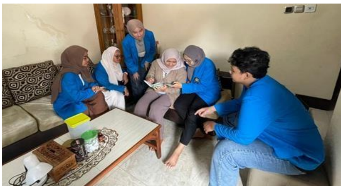
Gambar 3. Pendampingan untuk UMKM Tahu Nagih