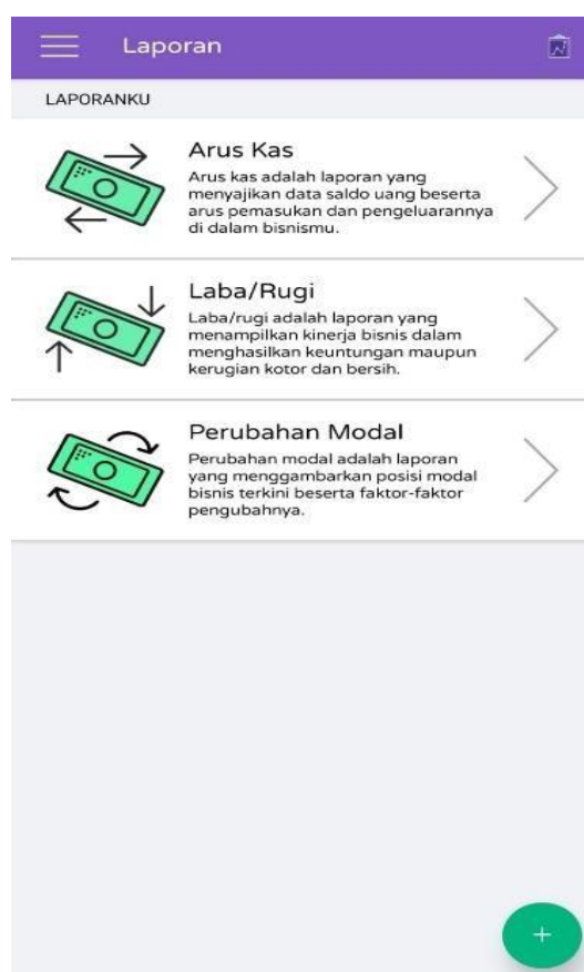
Gambar 5. Fitur utama Temanbisnis