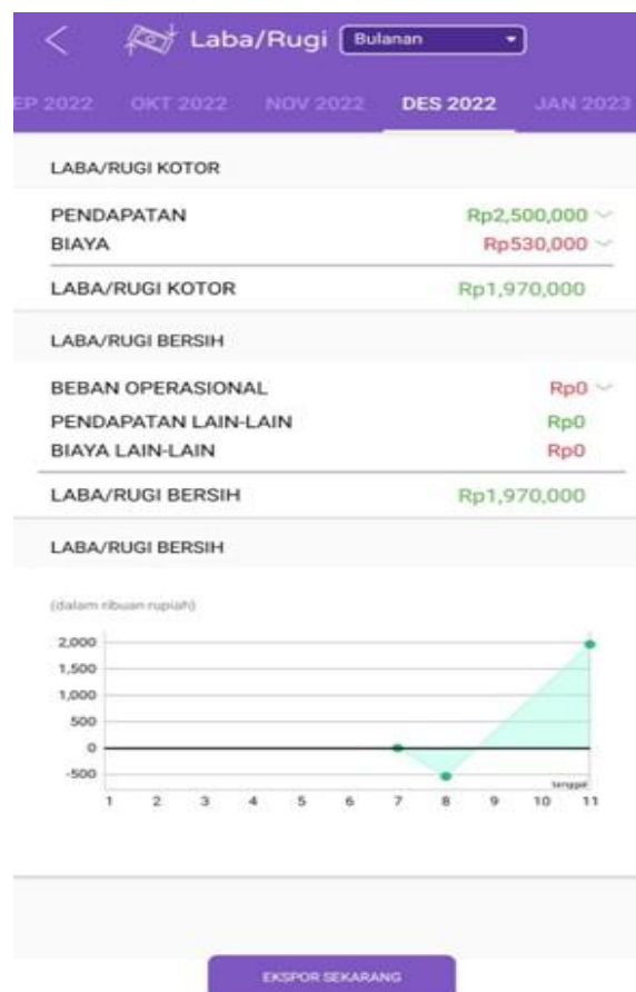
Gambar 7. Tampilan Hasil arus kas dan Laporan Laba/Rugi