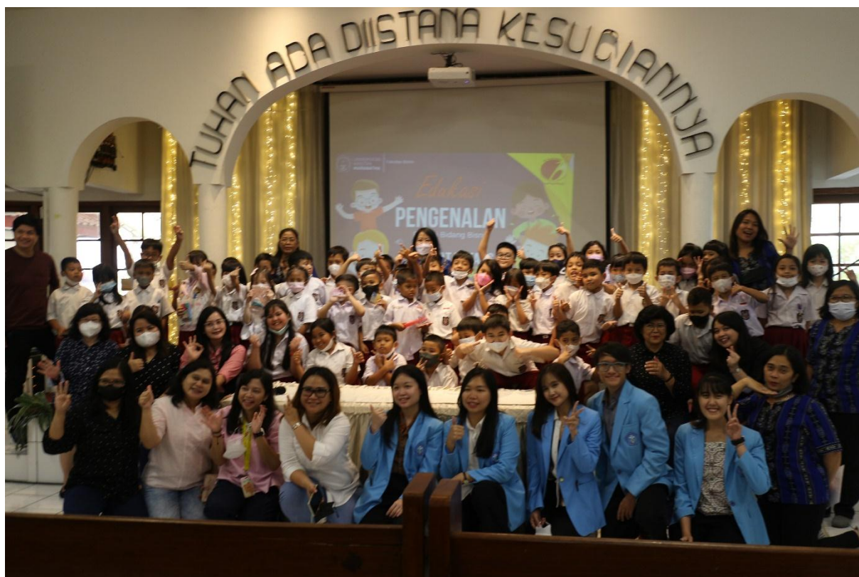
Gambar 3. Edukasi Profesi Bisnis Pada Anak Kelas 1 – 3 Sekolah Dasar