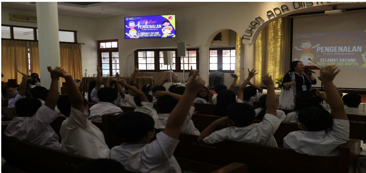
Gambar 2. Edukasi Profesi Bisnis Pada Anak Kelas 4 – 6 Sekolah Dasar

Setelah mendapatkan edukasi mengenai profesi bisnis, baik itu dalam bidang manajemen/kewirausahaan dan akuntansi, dilakukan post test mengenai cita-cita mereka. Hasil yang diperoleh adalah masih terdapatnya cita-cita lain, selain bergerak dalam bidang bisnis. Namun demikian, gambar I memperlihatkan bahwa pemilihan profesi bidang bisnis (pengusaha) menduduki peringkat tertinggi. Hal ini menunjukkan bahwa dengan adanya edukasi yang menarik mengenai bidang bisnis, maka siswa-siswa sekolah dasar ini memiliki gambaran baru mengenai profesi lain pada umumnya seperti dokter, atlet, youtuber dan sebagainya. Profesi bidang bisnis bagi mereka menjadi bagian yang cukup menarik untuk dipilih sebagai cita-cita mereka kelak di kemudian hari. Hasil testimoni dari kakak-kakak alumni yang telah sukses menjadi pengusaha, auditor, manajer dan lainnya melalui zoom , acara pengabdian masyarakat ini membawa kesan yang baik dan menyenangkan bagi mereka. Mereka dapat melihat bagaimana profesi bisnis juga membawa kesuksesan untuk masa depan.