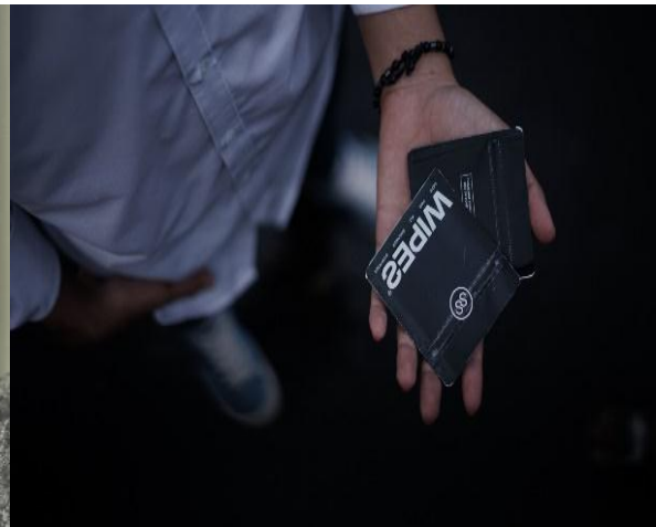
Gambar 3. Tissue pembersih permukaan sepatu