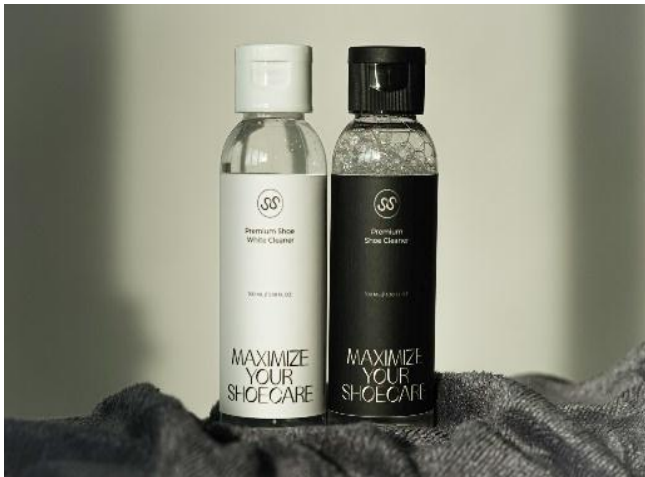
Gambar 2. Cairan Pembersih Sepatu