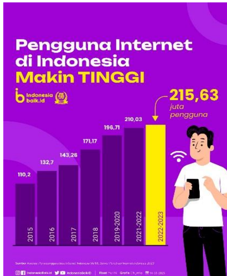
Gambar 1. Data Pengguna Internet di Indonesia.

Digital marketing adalah suatu strategi pemasaran dengan memanfaatkan kemajuan teknologi, seperti melalui media internet. Pengguna internet, setiap tahunnya selalu mengalami peningkatan. Pada sepanjang tahun 2022 sampai dengan tahun 2023, tercatat data pengguna internet sebanyak 215,63 juta pengguna (indonesiabaik.id, 2023). Peningkatan pengguna internet ini didorong oleh perubahan pola hidup masyarakat, dimana internet menjadi salah satu kebutuhan yang cukup penting, terutama bagi generasi muda.