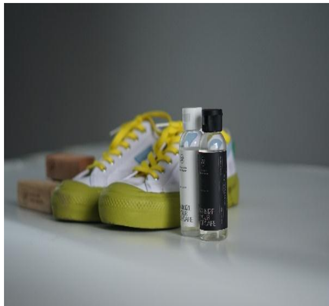
Gambar 4. Sepatu yang sudah dibersihkan dan di service