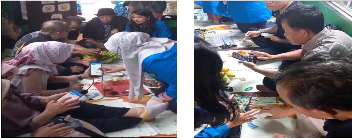
Gambar 3. Pelatihan penggunaan aplikasi Buku Warung, pelaku UMKM

gunakan untuk mencatat piutang pelanggan agar tidak lupa menagih dan Utang ke Supplier supaya tidak lupa untuk membayar.