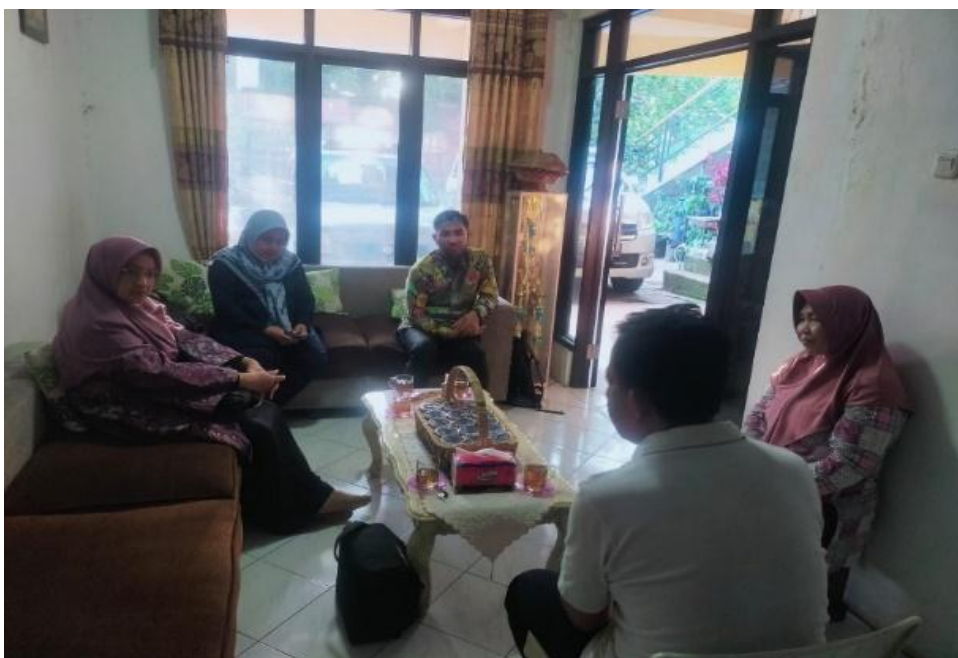
Gambar 1. FGD Permasalahan Mitra

Peserta kegiatan PkM ini diikuti oleh 16 UMKM LENTERA yang memiliki usaha-usaha yang berbeda, pada umumnya bergerak di bidang kuliner. Lokasi kegiatan bertempat di salah satu rumah inisiator pembentuk komunitas UMKM Lentera di jalan Raya Lenteng Agung Timur, RT.005/RW. 017, Jakarta Selatan. Selain itu, pemilihan lokasi pelatihan dikarenakan lokasi yang strategis dan kondusif untuk melakukan pelatihan.