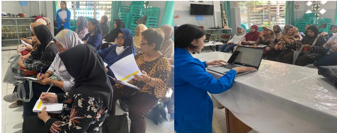
Gambar 4. Suasana Peserta Pelatihan

Persentasi diawali dengan menjelaskan pentingnya UMKM melakukan pembukuan dan penyusunan laporan keuangan. Selanjutnya mengerjakan kasus pembukuan dan penyusunan laporan keuangan. Pelaku UMKM diminta untuk mengerjakan kasus pembukuan yang didampingi oleh anggota tim lainnya. Pelatihan diikuti 19 pelaku UMKM dan 18 peserta berjenis kelamin Wanita dan hanya 1 (satu) orang peserta pria.