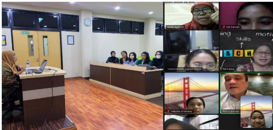
Gambar 3. Rapat Koordinasi Persiapan Pengabdian secara Zoom

Rapat penyusunan rencana pengabdian menetapkan susunan acara, pembawa acara, pemateri dan pendamping UMKM pada pembahasan kasus pembukuan. Rapat ini juga menetapkan jumlah dana yang dibutuhkan untuk pelaksanaan pengabdian.