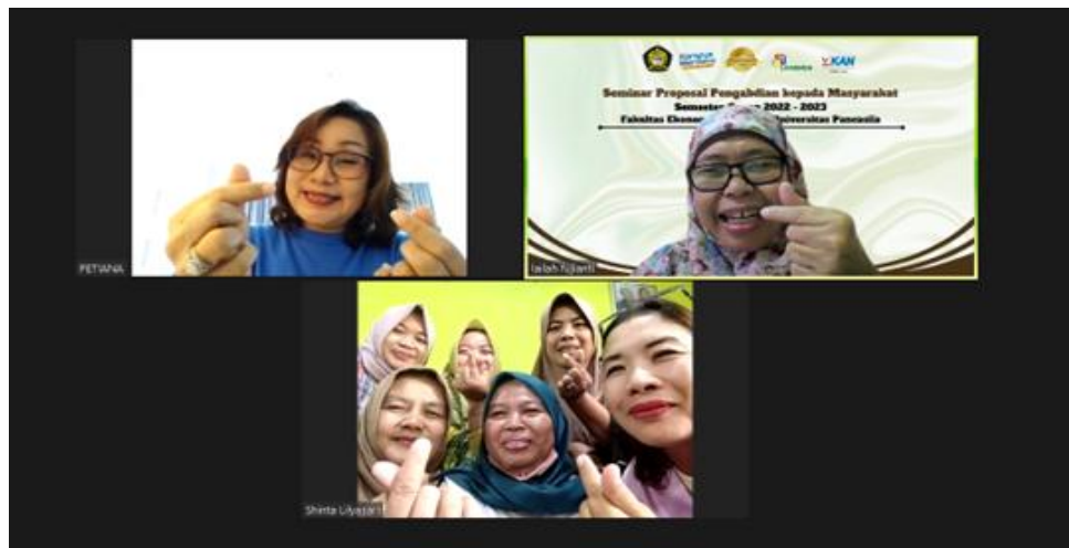
Gambar 2. Rapat Koordinasi Awal dengan Koordinator UMKM Kebon Manggis

waktu. Untuk pengabdian ini akan melakukan Pelatihan Pembukuan Usaha Bagi UMKM Kuliner Kebun Manggis Jakarta.