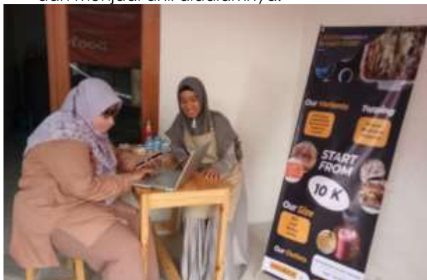
Gambar 3. Pelatihan penerapan Aplikasi Digital