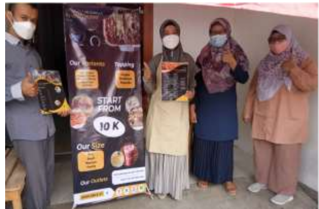
Gambar 2. Membuatkan Design Menu dan banner