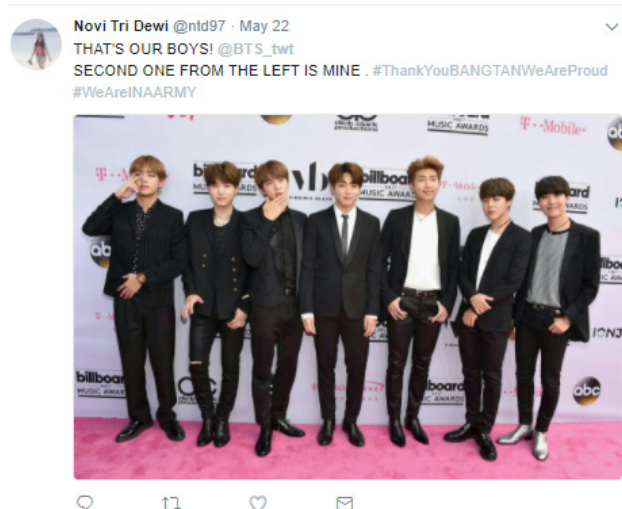
Gambar 2. Tweet pengungkapan emosi

dalam tweet tersebut. Seperti pada gambar 2 di bawah ini.