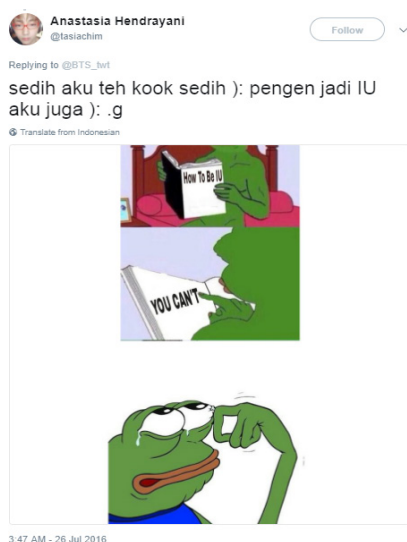
Gambar 3. Meme pengungkapan emosi

Rasa kecemburuannya pada IU dilampiaskan Tasia melalui meme yang ia buat sendiri. Fanbase INA adalah akun media sosial seperti Twitter fandom Army lokal yang ia kelola bersama beberapa teman sesama fans BTS. Di akun tersebutlah ia membagikan meme tersebut. Selain di akun fanbase , ia juga sempat membagikan meme itu di Twitter milik pribadinya seperti pada gambar di bawah ini: