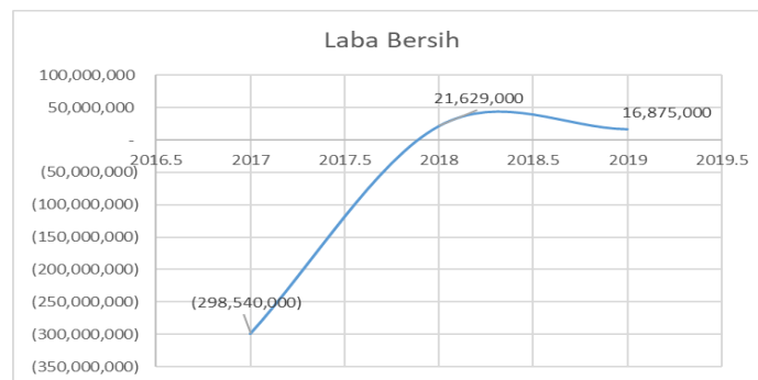
Gambar 1. Grafik Laba Bersih Bank Bjb Syariah

Bank baik konvensional maupun syariah, dikatakan baik apabila mampu mengembangkan dan meningkatkan kinerjanya baik secara finansial maupun operasionalnya. Naiknya pendapatan dana pihak ketiga dijadikan indikator sebagai naiknya kepercayaan masyarakat terhadap bank bersangkutan (Wahyuni & Fakhruddin, 2014). Dengan demikian agar semakin meningkatnya kepercayaan dari masyarakat maka bank harus dapat menjaga dan meningkatkan kinerjanya termasuk dalam hal ini bank bjb syariah. Berdasarkan data lapangan, kinerja Bank BJB Syariah mengalami fluktuasi dan tidak mencapai target. Dalam laporan keuangan Bank BJB Syariah 3 tahun terakhir, seperti pada grafik di bawah ini: