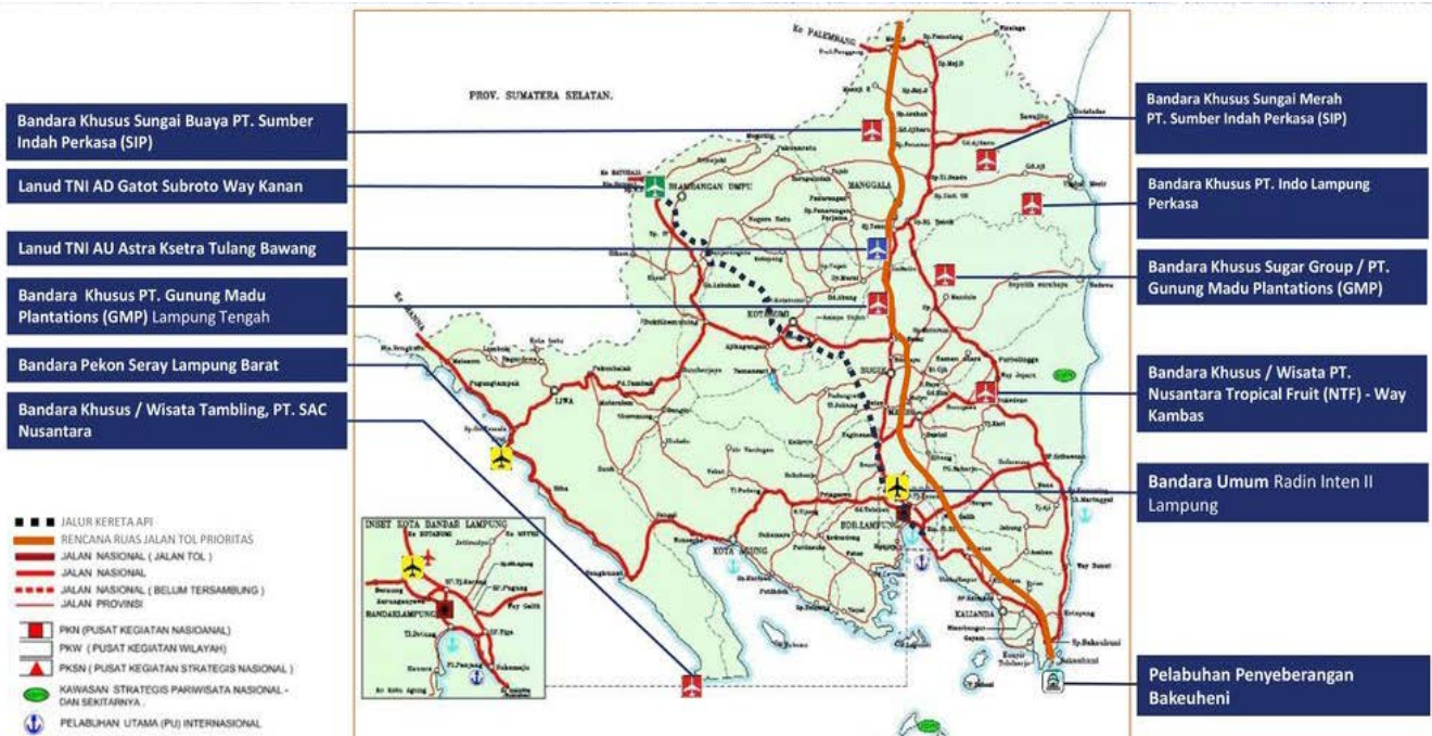
Gambar 1. Profil Infrastrukture Profinsi Lampung

Lampung memiliki potensi ekonomi yang luar biasa seperti jumlah penduduk terbesar nomor 2 di Pulau Sumatera, memiliki wilayah yang cukup luas, industri & perdagangan, agro industri, pertambangan, perikanan & kelautan, pariwisata & perhotelan dan masih banyak industri dan jasa lainnya sehingga perlu didukung adanya suatu kawasan yang bisa terjangkau transportasi umum dari efisiensi waktu dan biaya