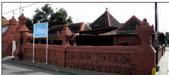
Gambar 2. Masjid Merah Panjunan