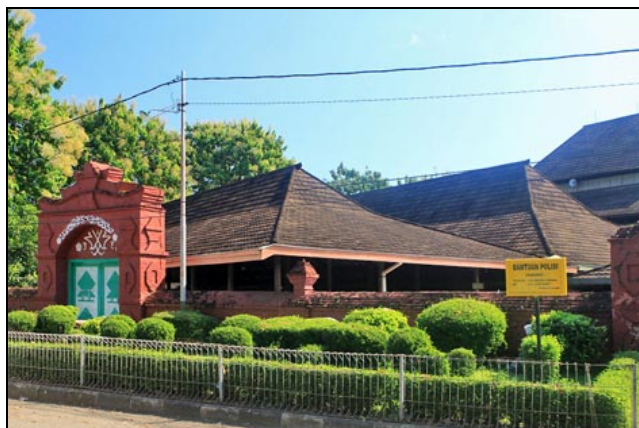
Gambar 1. Masjid Sang Cipta Rasa

kondisi teraktual dari sarana dan prasarana obyek penelitian. Hasil deskripsi dibandingkan standar peraturan yang berlaku di Indonesia baik tentang bangunan gedung maupun kepariwisataan. Tahap akhir penelitian berupa kajian untuk memperoleh kesimpulan mengenai kesiapan sarana dan prasarana Masjid Sang Cipta Rasa dan Masjid Panjunan sebagai pendukung city branding di kota Cirebon.