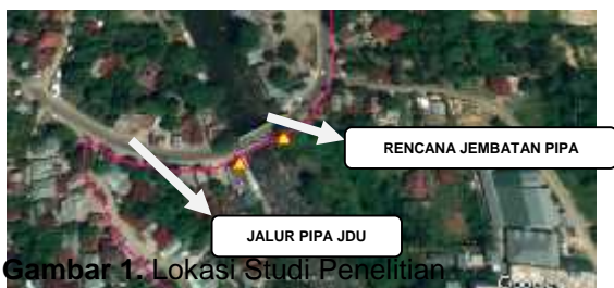
Gambar 1. Lokasi Studi Penelitian

Penelitian ini dilakukan pada jembatan pipa sungai Batee Iliék Samalanga pada bulan Juli 2018