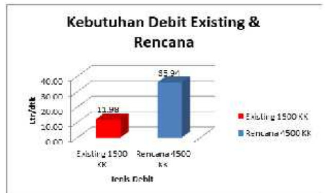
Gambar 2. Kebutuhan Debit Existing dan Rencana