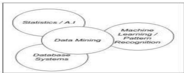
Gambar 1. Data mining Sebagai Irisan Beberapa Bidang

Data mining merupakan suatu area yang mengintegrasikan berbagai metode yang meliputi statistic, basis data, kecerdasan buatan (artificial intelligence), machine learning, pengenalan pola (pattern recognition), serta pemodelan yang mengenai ketidakpastian.