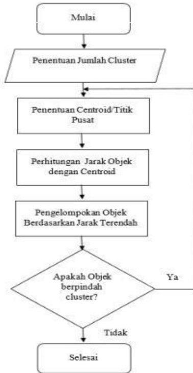
Gambar 2. Alur Segmentasi dengan K-Means

untuk digunakan nanti. adalah pusat cluster asli, dalam Menentukan pusat cluster dipilih secara acak dari kumpulan data. Algoritma kmeans kemudian memeriksa setiap elemen dari kumpulan data dan menandai elemen tersebut di salah satu pusat cluster yang telah ditentukan sebelumnya. berdasarkan jarak minimum antara komponen dengan setiap pusat cluster maka posisi pusat cluster akan dihitung ulang sampai semua elemen data diranking pada setiap cluster dan akhirnya akan terbentuk cluster baru.