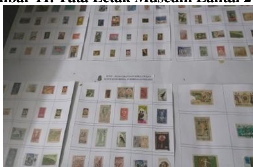
Gambar 11. Tata Letak Museum Lantai 2