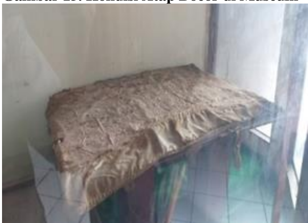
Gambar 15. Kondisi Atap Bocor di Museum