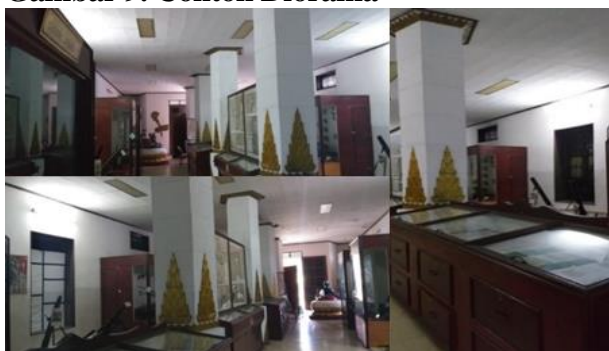
Gambar 9. Contoh Diorama