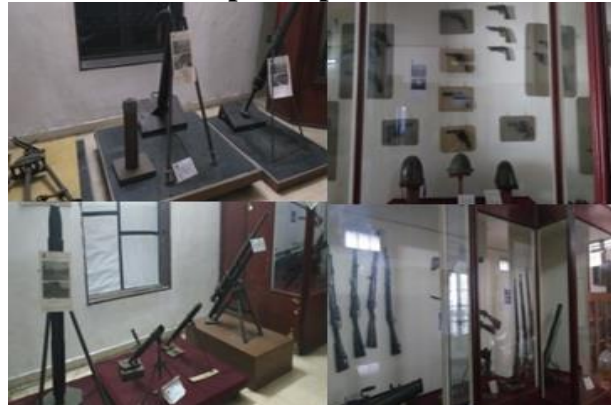
Gambar 5. Tampak depan Museum