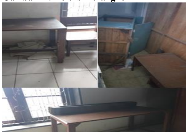
Gambar 12. Koleksi Perangko