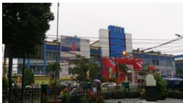
Gambar 2 Tampak Depan Museum