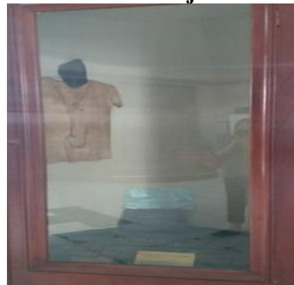
Gambar 6. Koleksi Senjata