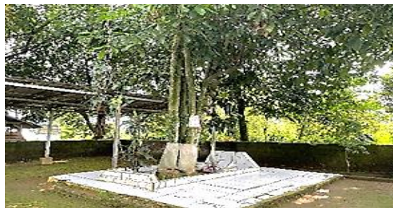
Gambar 1. Makam Leluhur Desa Hambalang

Ziarah makam secara sederhana dapat berarti berkunjung ke makam. Menurut syariat agama Islam, ziarah kubur bukan hanya sekedar menengok kubur, akan tetapi kedatangan seseorang ke kubur atau ke makam dengan maksud untuk berziarah adalah mendoakan kepada yang dikubur atau yang dimakamkan dan mengirim do'a untuknya. Desa Hambalang memiliki destinasi wisata religi makam leluhur bagi masyarakat Desa Hambalang itu sendiri. Makam tersebut antara lain adalah makam Syekh M. Maulana Mansur, Raden Ismail Sunsang, Mbah Haji Naimulloh, dan Eyang Raden Syamiadji Wali Kontan. Dengan adanya makam leluhur tersebut timbulah kegiatan wisata religi yang dilakukan oleh warga desa maupun warga dari luar desa.