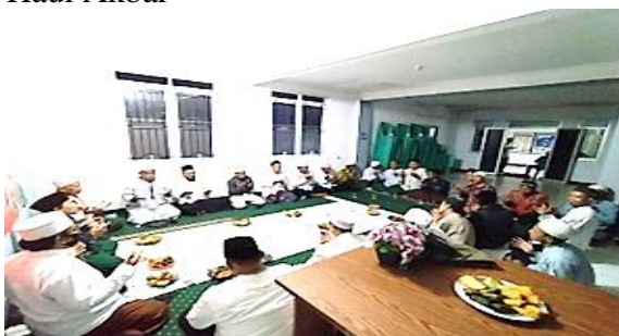
Gambar 2. Haul Akbar Desa Hambalang

Haul merupakan upacara peringatan ulang tahun wafatnya seseorang (terutama tokoh agama islam), dengan berbagai acara, Pada puncak acara Haul, masyarakat melaksanakan ziarah kubur almarhum atau almarhumah tokoh agama islam. Di Desa Hambalang sendiri merayakan haul atau Maulid Nabi Muhammad SAW dengan acara haul akbar yang dilakukan setiap tahunnya. Acara haul akbar ini diikuti oleh ribuan warga atau jama'ah dari berbagai pelosok desa maupun dari luar desa. Acara haul atau Peringatan Maulid Nabi ini diisi dengan tabligh akbar oleh tokoh besar agama.