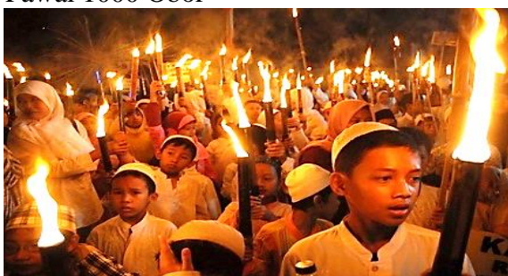
Gambar 3. Pawai Obor Sumber: Dokumentasi Peneliti, 2022.

Pawai 1000 Obor merupakan salah satu kegiatan rutin tahunan di Desa Hambalang pada bulan suci Ramadhan yang diselenggarakan oleh Karang Taruna Desa Hambalang. Kegiatan ini merupakan ajang silaturahmi warga Desa Hambalang di bulan Ramadhan dengan dihadiri oleh lebih dari 1000 orang yang berasal dari masyarakat Desa Hambalang.