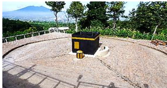
Gambar 4. Miniatur Ka'bah Desa Hambalang

Miniatur Ka'bah merupakan sebuah benda atau objek yang bersifat tiga dimensi berskala lebih kecil dari objek aslinya (Ka'bah) yang digunakan oleh umat Muslim sebagai media pembelajaran sebelum melaksanakan kegiatan umrah dan haji atau yang disebut dengan manasik haji. Desa Hambalang memiliki salah satu objek wisata religi miniatur Ka'bah. Objek wisata miniatur Ka'bah tersebut biasanya dikunjungi oleh siswa sekolah.