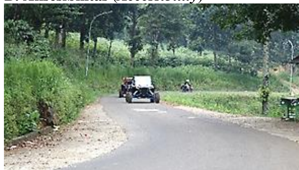
Gambar 5. Aksesibilitas Desa Hambalang

Kondisi aksesibilitas menuju wisata religi ziarah makam dikatakan masih kurang baik. Hal tersebut dikarenakan lokasi makam yang terbilang cukup jauh dari kantor Desa Hambalang yaitu berada di atas bukit dan memiliki akses jalan yang sempit sehingga