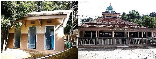
Gambar 6. Amenitas Desa Hambalang

Fasilitas penunjang yang telah tersedia di Desa Hambalang antara lain: