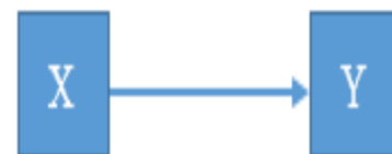
Gambar 2. Desain Penelitian

Desain penelitian ini merupakan desain penelitian uji coba produk untuk mengetahui hasil dari kinerja prototype sistem peringatan ganti oli pada sepeda motor matic yang menggunakan oli SAE 10W – 30 dengan memanfaatkan mikrokontroler Arduino dibandingkan dengan hasil viskositas oli SAE 10W – 30.