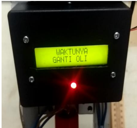
Gambar 4 Peringatan Ganti Oli